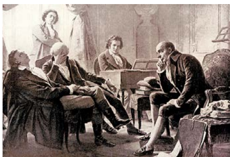
Un ritratto di Beethoven (1770-1827) mentre suona il piano per alcuni amici.

Come direttore d'orchestra, ammiro infinitamente questa geniale creazione, la forza e le energie che ne vengono liberate nell'orchestra, i momenti più splendidi e intimi, tutto della massima perfezione. Se poi si considera che Beethoven era ormai completamente sordo e che doveva far nascere tutto ciò solo con la sua immaginazione e nella sua mente, senza la minima possibilità di poter mai ascoltare anche solo una nota, allora mi vengono i brividi. GVN